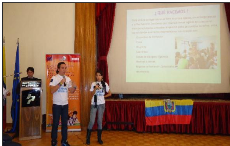
Ecuador, explicación de su experiencia de trabajo

Las técnicas de mayor uso durante el evento internacional fueron la “lluvia de ideas”, el trabajo en grupos de discusión, el debate y las exposiciones en plenaria.