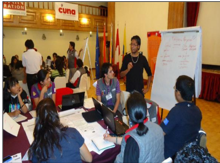
Fotografía N° 2 Trabajo en mesas de discusión

El proceso de reflexión de las cuatro temáticas planteadas: salud, educación, justicia y promoción de derecho, demandó de las y los presentes un debate de buen nivel. A continuación los primeros resultados expuestos en Plenaria: